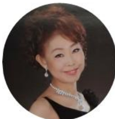
伴 真純 (ソプラノ)